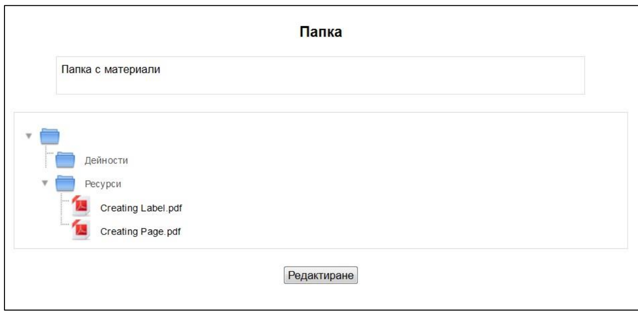
Фигура 2. Редактиране съдържанието на папка